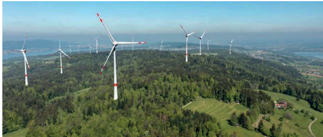
Mit Zürichsee und Uto, Zürichberg und Dübendorf. Visualisierung www.fl-zh.ch