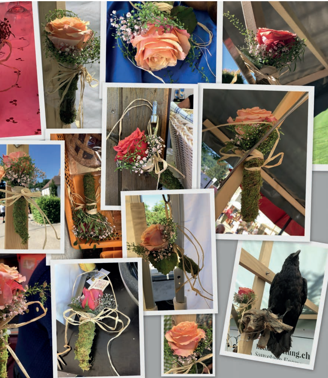
ese wurden ganz unterschiedlich gewürdigt und am Stand platziert.