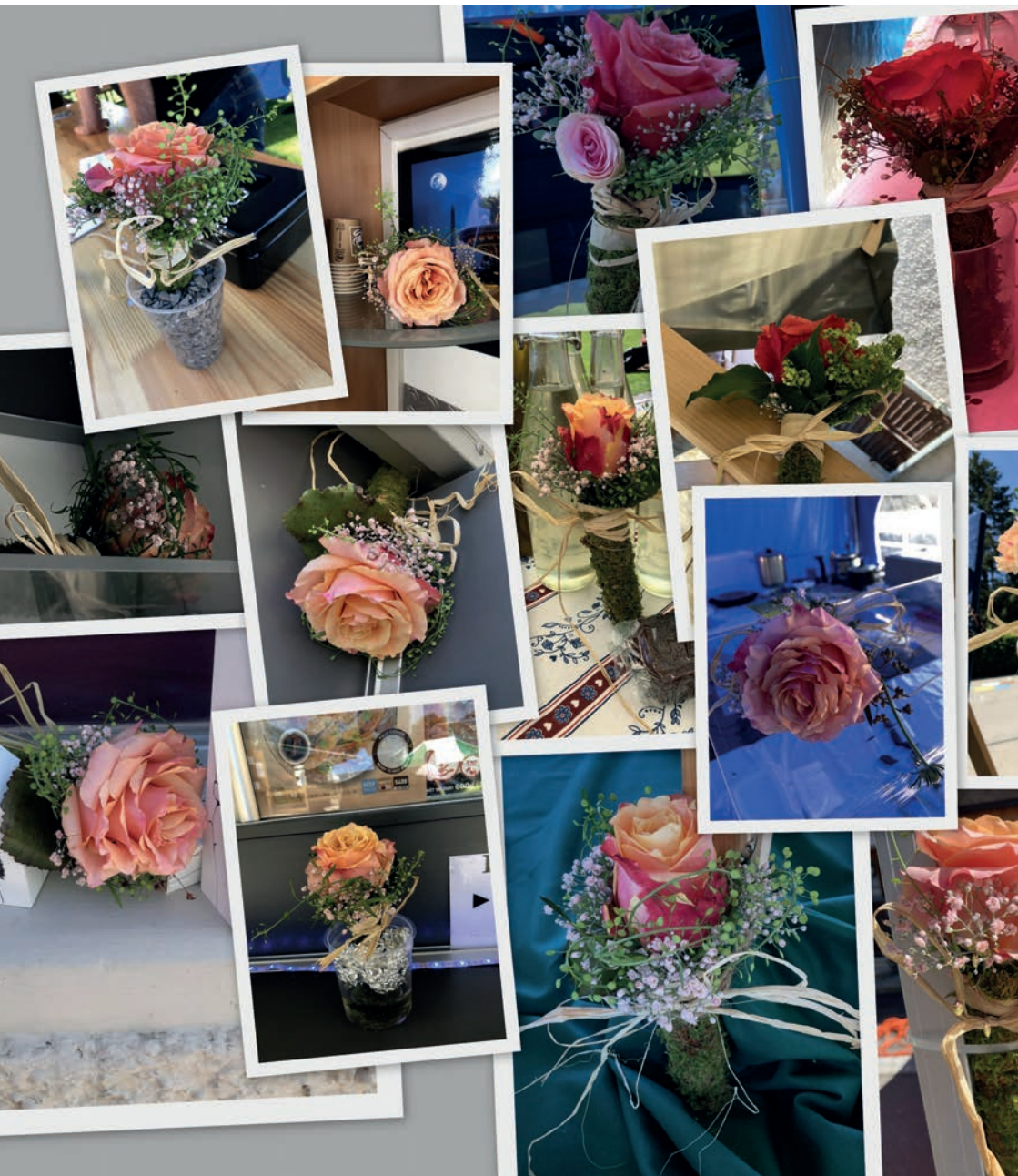
Der Gewerbeverein hat am Dorfmarkt 2022 jedem Standbetreiber eine Rose geschenkt. Di