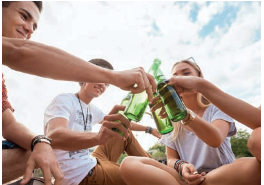
Die Eltern-Infoline hilft bei Fragen zu Konsum und Substanzen.

Mit 16 oder 18 Jahren ist der Körper noch in Entwicklung und die Selbstkontrolle in der Pubertät eingeschränkt. Alkohol wirkt stärker als bei Erwachsenen. Dass es bis zu einer Stunde dauern kann, bis Alkohol wirkt, unterschätzen Jugendliche oft. Mit einer klaren Haltung helfen Sie Jugendlichen beim Umgang mit Alkohol.